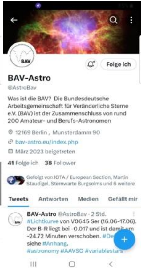
Abb. 2: Ansicht der BAV-Seiten von Instagram und Twitter